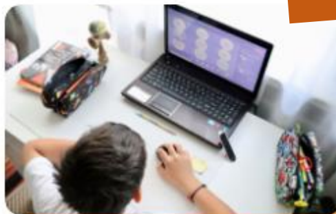
網路課程 - OnO