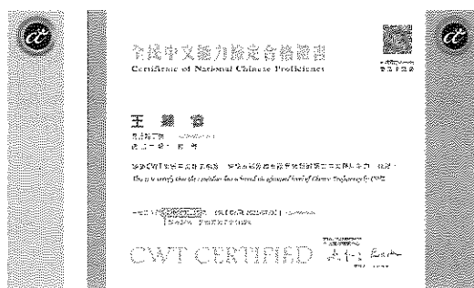
※高、優等證書證號示意圖